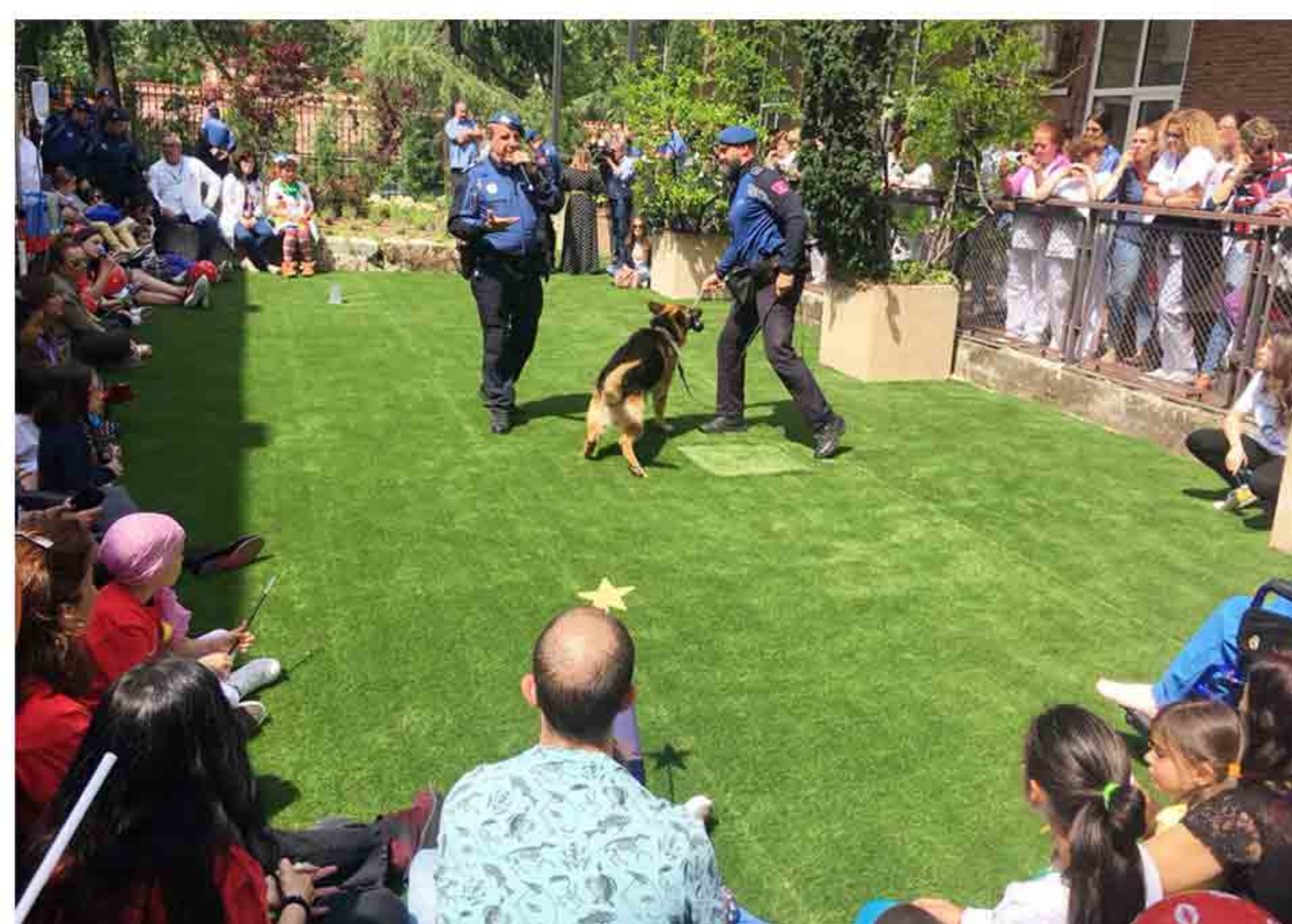
La Unidad Canina de la Policía Municipal participa en el acto del Día del Niño Hospitalizado en el patio del Hospital Niño Jesús.