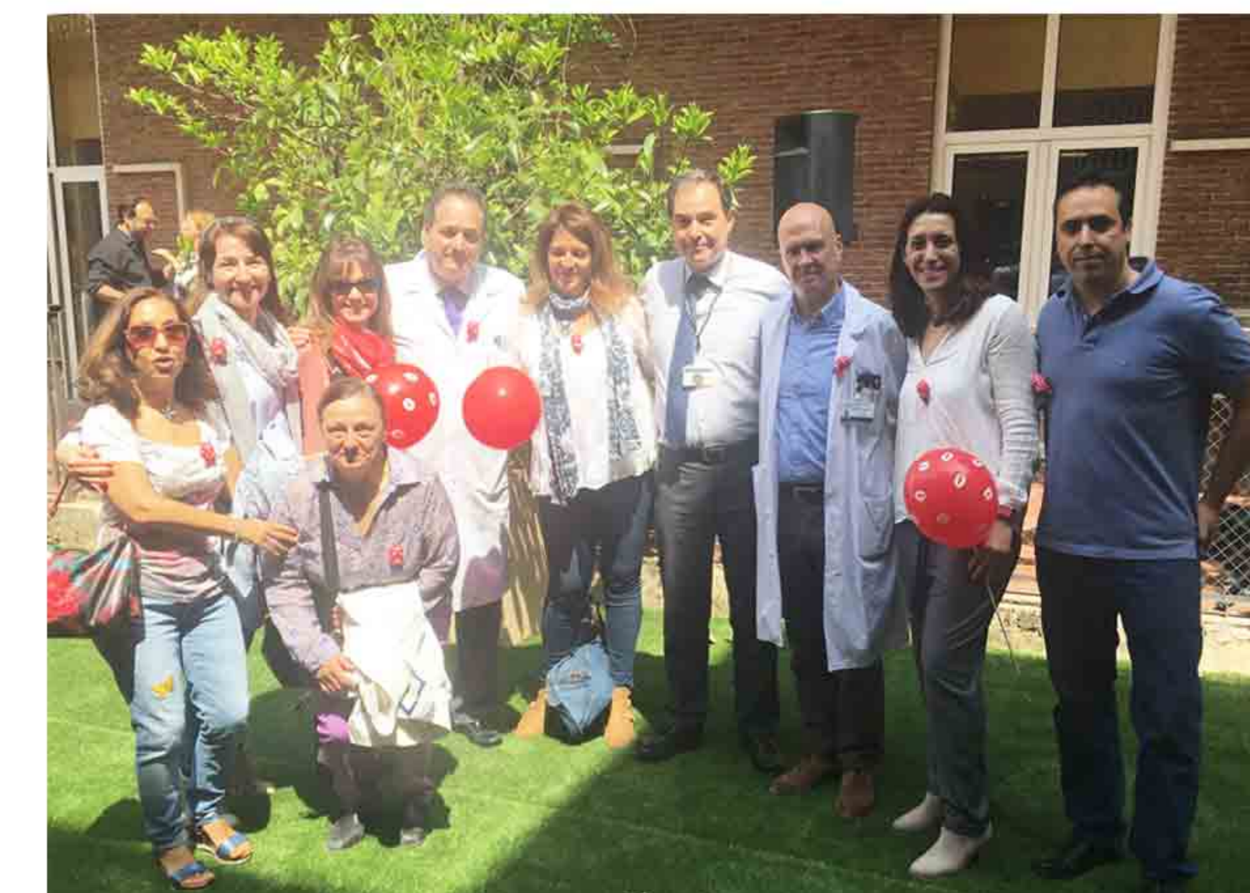
Representantes de CSIT UNIÓN PROFESIONAL con el Gerente del Hospital Niño Jesús.