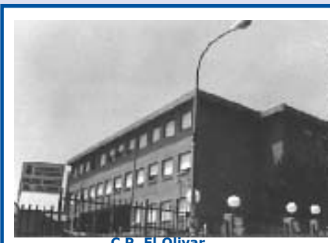
C.P. El Olivar

Es más difícil que un desamparado entre en la escuela concertada que un camello pase por el ojo de una aguja.