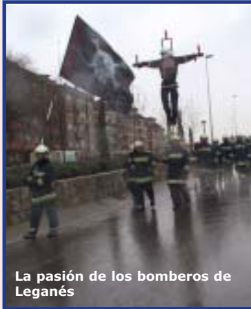
La pasión de los bomberos de Leganés

Después de una crucifixión paseada por todo el municipio en procesión, de una acampada a pie del Ayuntamiento, de una romería bomberil desde Leganés hasta la calle Ferraz para protestar frente a la sede