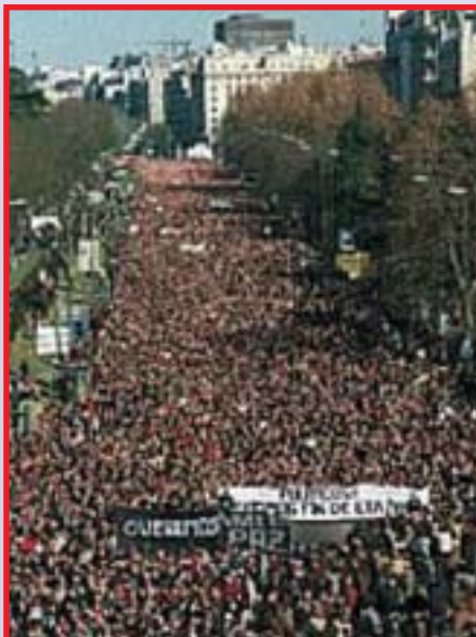
Millones de madrileños se echaron a la calle en silenciosa protesta por el atentado

trabajadores laborales públicos. No se debe perjudicar a la mayoría cuando desde lo que tenemos se puede articular todo. Los sindicatos mayoritarios de ámbito general, CSIT-Unión Profesional, CCOO y UGT, debemos reflexionar sobre este hecho y darnos cuenta de que las luchas que cada uno de nosotros podamos mantener en nuestros ámbitos internos son personales y circunstanciales y que nunca deben poner en peligro la unidad negociadora que tantos beneficios ha aportado al conjunto de los trabajadores públicos. A CSIT- Unión Profesional no le gustan los chiringuitos ni los sindicalistas disfrazados del Carod Rovira de turno.