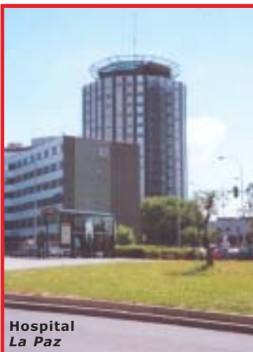
Hospital La Paz

Desde el primer momento CSIT-Unión Profesional abogó una y otra vez por corregir esa injusticia, defensa a la que se sumaron las otras organizaciones sindicales más representativas de Comunidad de Madrid. La reiterada negativa de la Administración nos forzó, como única salida para garantizar sus derechos, a demandar a la misma ante los Tribunales de Justicia. No encontramos ni un solo apoyo de las otras Organizaciones que dicen defender a los trabajadores e, incluso topamos con la oposición en juicio de algunas de esas representativas del sector, sentadas increíblemente en el mismo banco que la Administración. Esos tribunales nos dieron la razón respecto al personal laboral en formación (MIR y DIR), reconociendo rotundamente su derecho a esa integración. No lo hicieron con el resto del personal laboral por el oscurantismo del IMSALUD en cuanto a definir su número y sus distintas categorías y por su afán de tergiversar datos y confundir al Tribunal. Que nos esperen, porque también eso lo ganaremos.