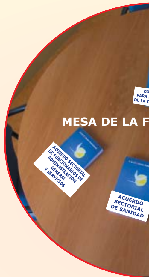
MESA DE LA F

Intentar negociar el Estatuto Marco del Personal sanitario de la Comunidad de Madrid fuera del ámbito referido o, al menos, sin el control de nuestra Función Pública es como para llorar.