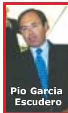
Pío García Escudero

Los nuevos Consejeros son gente brillante, algunos ministrables y llegaron desde los cuatro puntos cardinales: Ayuntamiento, Ministerio de Educación, Ministerio de Economía y Senado. El eje Esperanza Aguirre - Rodrigo Rato - Rajoy funcionó. El Vicepresidente económico precisa situar a sus colaboradores. Esperanza Aguirre hace memoria de su pasado en el Ayuntamiento, Ministerio de Educación y Senado y se trae a algunos de sus más allegados; Desde ahí, "la renovación en Madrid" se antoja total. Claro que Ruiz-Gallardón fue el primero que comenzó este baile en el Ayuntamiento... ¡contentos tiene a los Técnicos!