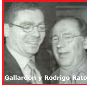
Gallardón y Rodrigo Rato

Los nuevos Consejeros son gente brillante, algunos ministrables y llegaron desde los cuatro puntos cardinales: Ayuntamiento, Ministerio de Educación, Ministerio de Economía y Senado. El eje Esperanza Aguirre - Rodrigo Rato - Rajoy funcionó. El Vicepresidente económico precisa situar a sus colaboradores. Esperanza Aguirre hace memoria de su pasado en el Ayuntamiento, Ministerio de Educación y Senado y se trae a algunos de sus más allegados; Desde ahí, "la renovación en Madrid" se antoja total. Claro que Ruiz-Gallardón fue el primero que comenzó este baile en el Ayuntamiento... ¡contentos tiene a los Técnicos!