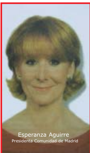
Esperanza Aguirre Presidenta Comunidad de Madrid

Esta publicación contiene información sindical y, como tal, está amparada por la ley. Debe ser expuesta en los tablones de información sindical que tiene cada centro. Las acciones que obstaculicen su distribución y publicidad están penadas por las leyes vigentes.